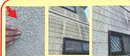
チョーキング コケ(藻) 色あせ