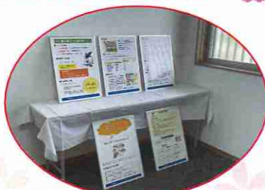
見学会の中の様子

先月、鳥栖市にて2棟竣工致しました！ 完成見学会では、各会場に約60名近くの方にご来場頂きました。