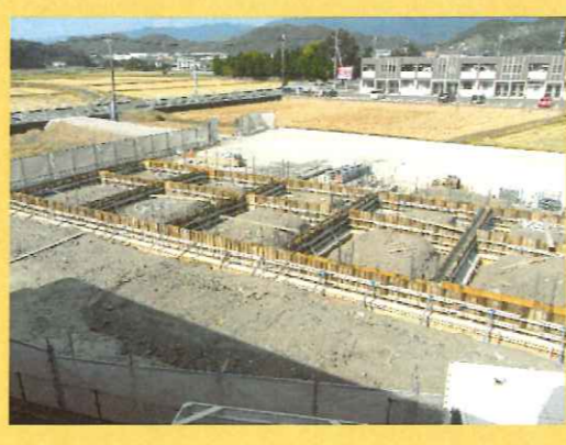
地中梁 (鉄筋・型枠) 完了